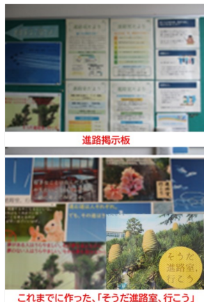
これまでに作った、「そうだ進路室、行こう」

校舎2階に上がる階段の踊り場に、進路掲示板があります。ここには、季節の写真とメッセージとともに「そうだ進路室、行こう」と呼びかけています。CMのコピーのようですが、生徒から「今回の言葉グッときました。」とか言われると、嬉しくなって新たなメッセージを考えてしまいます。